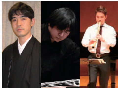
(一般部門)審査員特別賞 受賞 Free Style