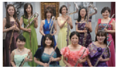
特別ゲスト: 第1回 大賞 受賞 フルートアンサンブル'90