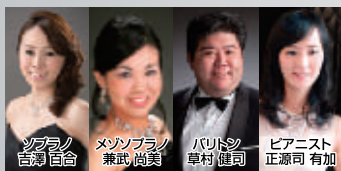
グループ・ヴィュー