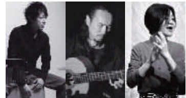
ゲスト: Universal Flamenco Orchestra