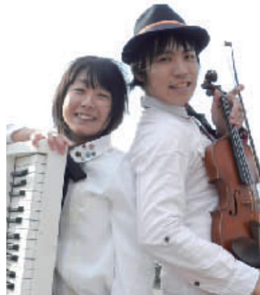
特別ゲスト: 第1回 聴衆賞 受賞 ORANGE