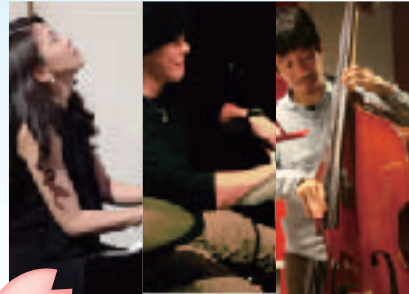
13:00~13:30 Trio Seagal ~トリオ・セガル~