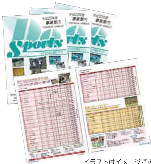
イラストはイメージです